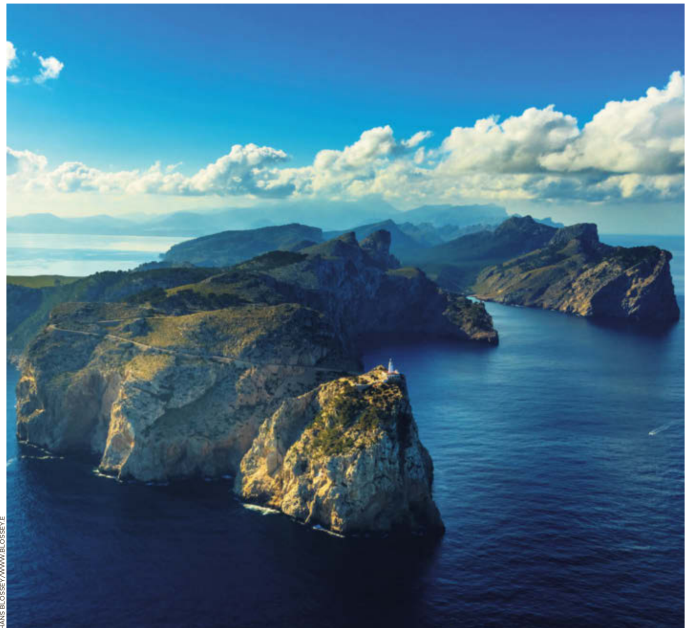
Exponierte Lage: Cap Formentor mit seinem Leuchtturm, eines der eindrucksvollsten Bilder aus „Mallorca von oben“