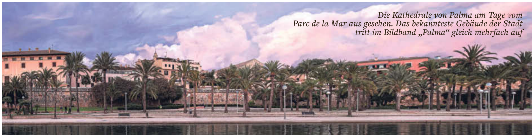
Die Kathedrale von Palma am Tage vom Parc de la Mar aus gesehen. Das bekannteste Gebäude der Stadt tritt im Bildband „Palma“ gleich mehrfach auf