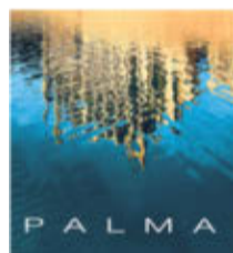
Palma, Verlag Travel Publishing, 320 S., 78 Euro, erhältlich nur über mallorca-schoene-seiten.de