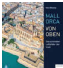
Mallorca von oben: Die schönsten Luftbilder der Insel , Klartext Verlag 2021, 160 Seiten, 18,95 Euro

Ganz neue Blickwinkel bietet Hans Blosses Bildband „Mallorca von oben“. Der Fotograf füllte 160 Seiten mit Luftaufnahmen, geschossen unter anderem aus einer einmotorigen Piper PA18. Mit der flog er kreuz und quer über die Insel, von den Gipfeln der Serra de Tramuntana über die Hauptstadt Palma bis zur Pla de Mallorca, einer Ebene in der Inselmitte, vom hügeligen Mogjorn im Insel Süden bis nach Llevant im Osten mit seinen Steilküsten.